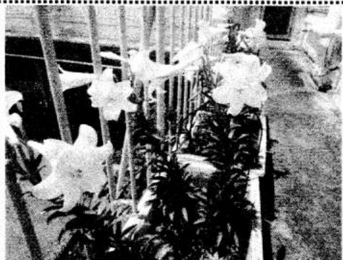
5月23日 今年も職員室前のベランダで「えらぶゆり」(沖永良部島特産)が咲きました。