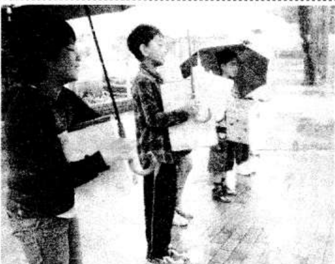
5月17日 熊本地震の被災者の方のために代表委員が募金活動を行いました。