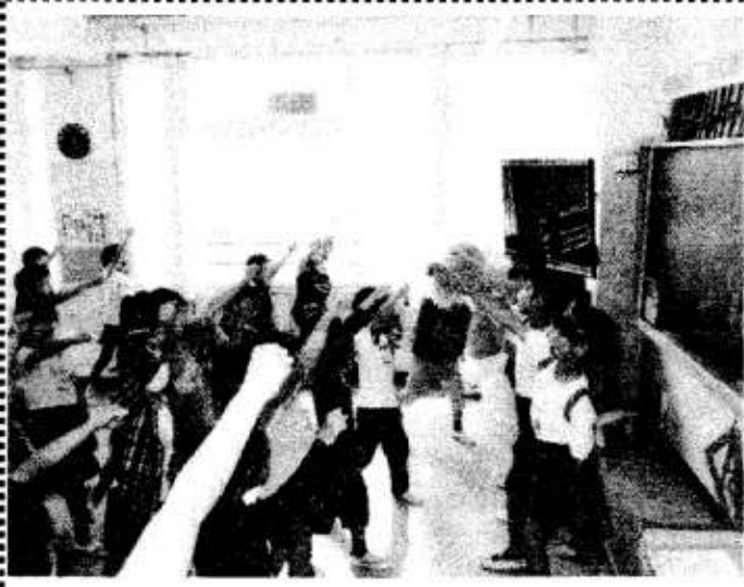
5月19日 運動会応援団が各クラスに出向き、応援の練習を行いました。