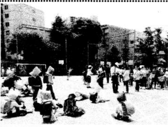
5月7日 引き渡し訓練 保護者の方々に確実に引き渡し、家まで安全に帰る訓練を行いました。