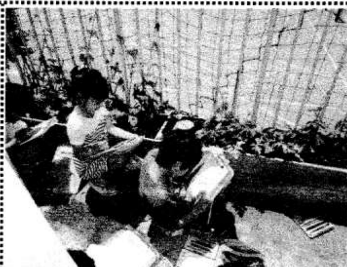
5月12日 4年生が壁面緑化の成長したヘチマやキュウリの観察をしました。