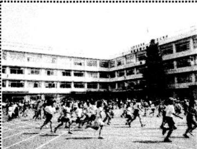
5月24日 朝のランニングタイム 2月の持久走大会を目指して、がんばります。